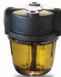
Με το νέο Πετρέλαιο Θέρμανσης από την ΕΚΟ