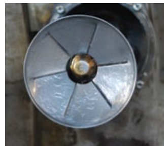
Με το νέο Πετρέλαιο Θέρμανσης από την ΕΚΟ