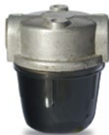
Με το απλό Πετρέλαιο Θέρμανσης χωρίς πρόσθετα