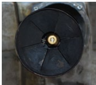
Με το απλό Πετρέλαιο Θέρμανσης χωρίς πρόσθετα